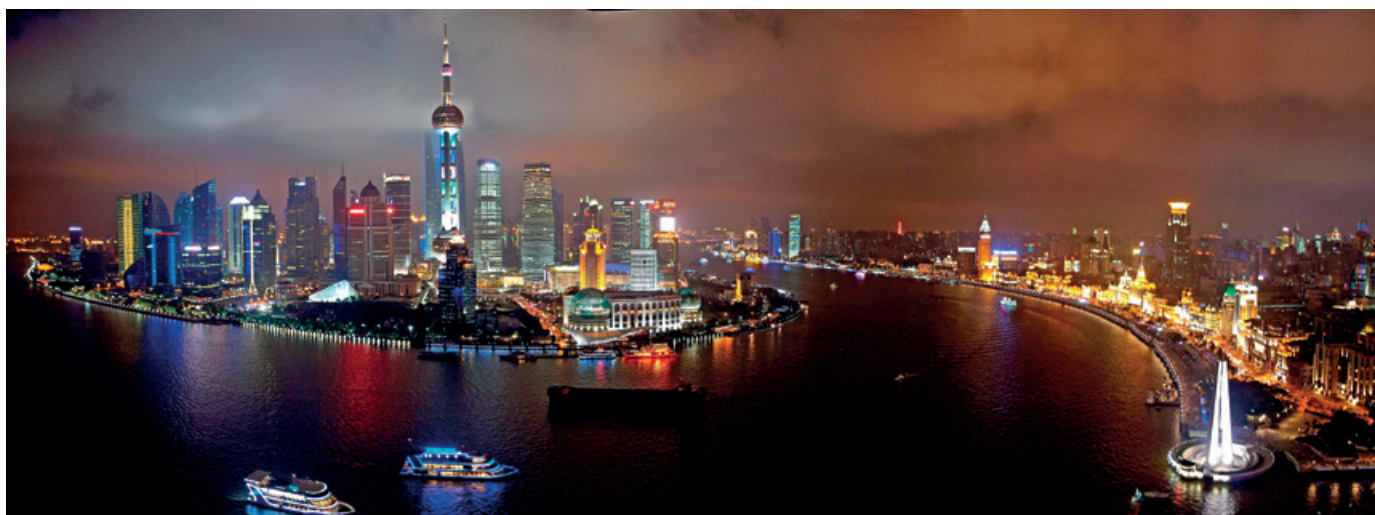
Pudong, Shanghái. Una urbe de más de 23 millones de habitantes.