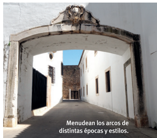
Menudean los arcos de distintas épocas y estilos.