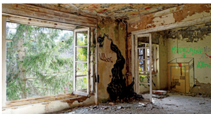
Restos de una casa abandonada en un pueblo de Aragón.