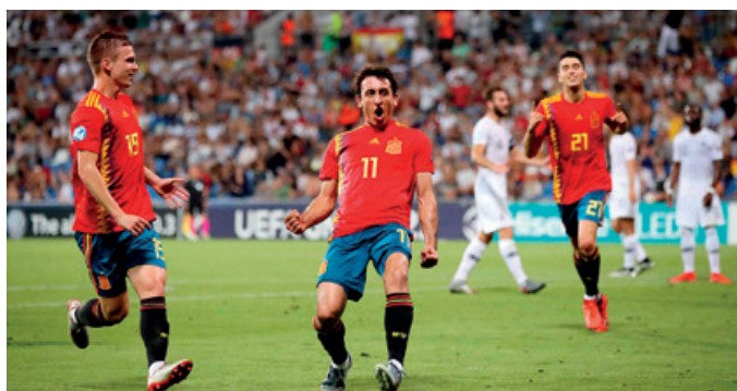
Mikel Oyarzabal celebra su gol a Francia.