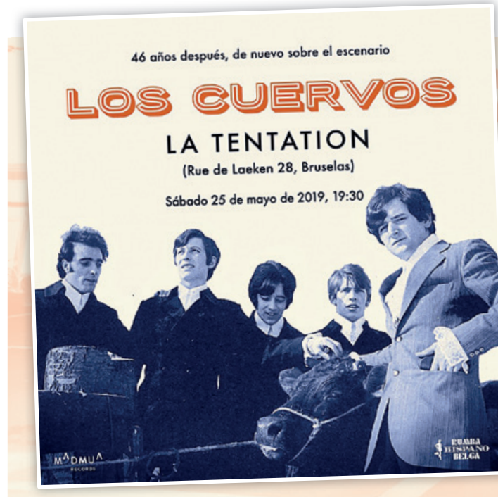
Postal del Concierto 46 años.