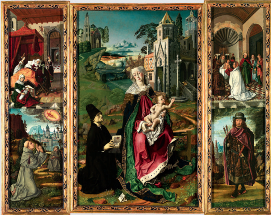
“Tríptico de la Virgen de Montserrat” (1470-75). Catedral de Acqui Terme.