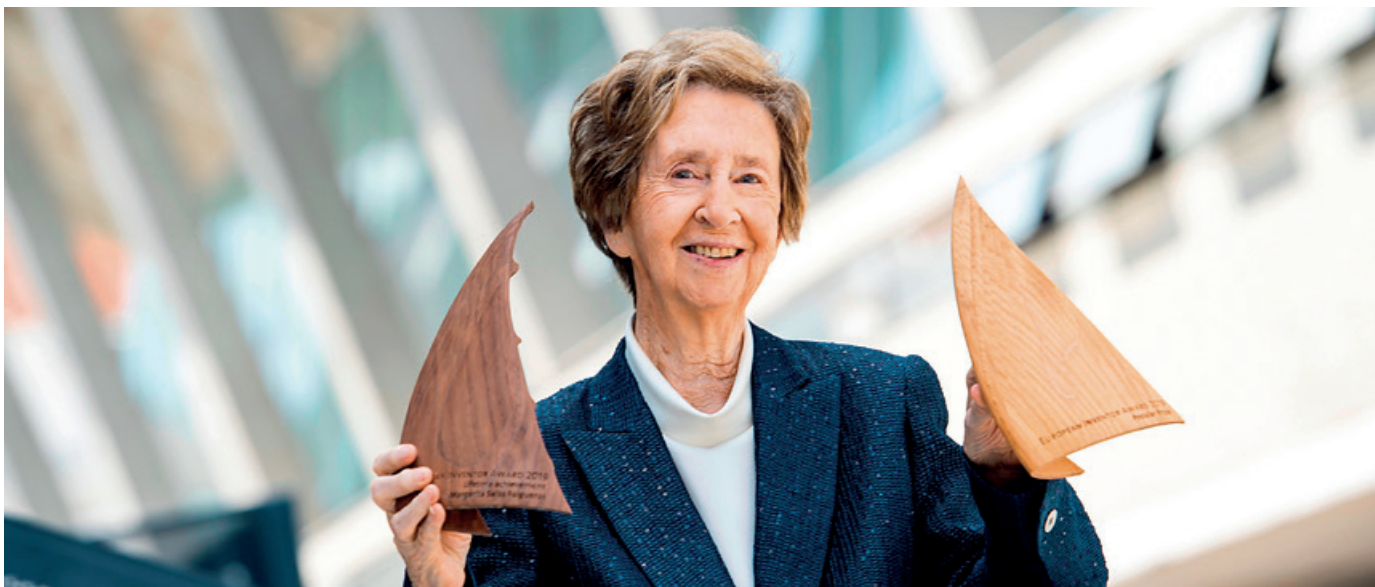
Margarita Salas, doctora en Bioquímica por la Complutense.

La investigadora del CSIC Margarita Salas lo obtiene por su trayectoria científica innovadora en genética y biología molecular