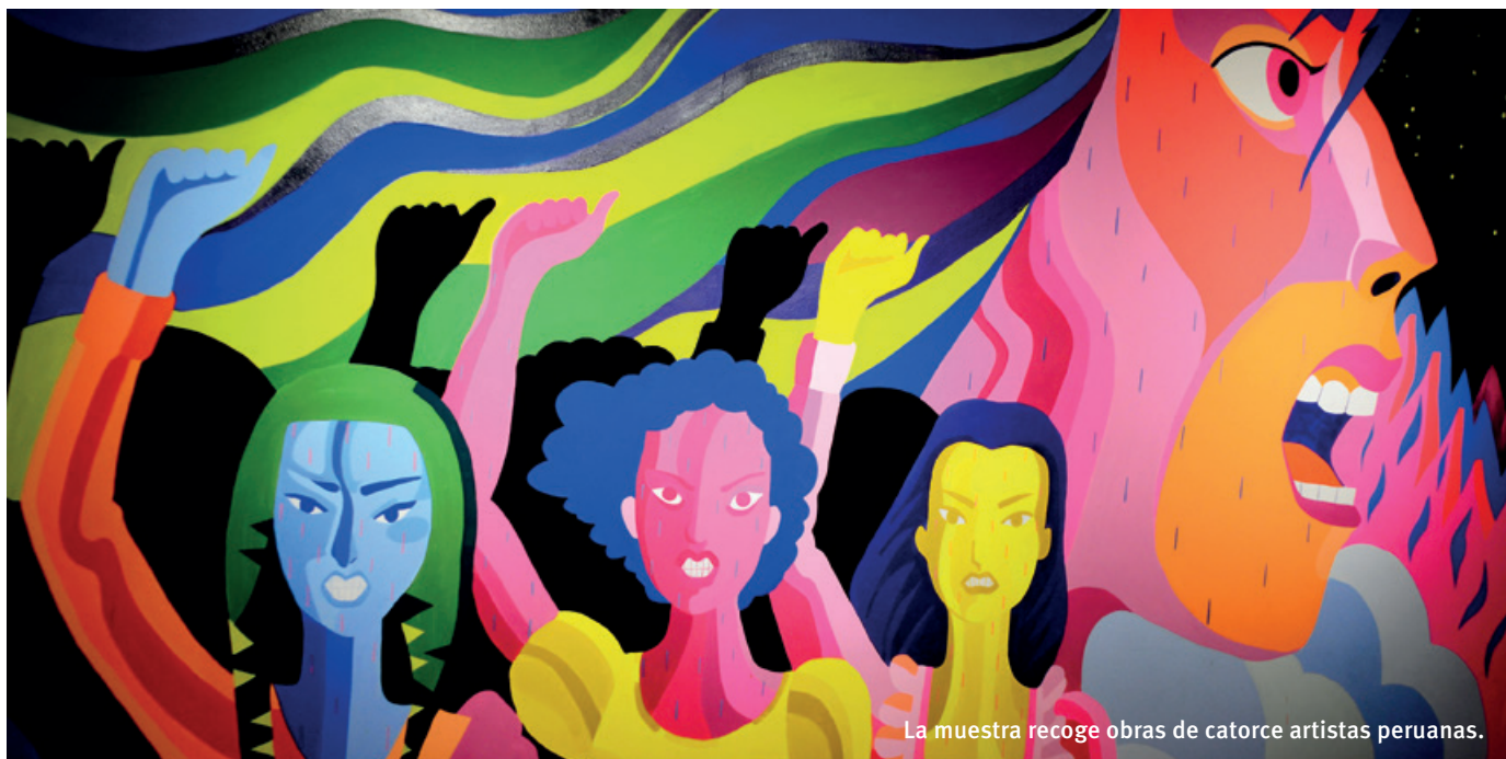
La muestra recoge obras de catorce artistas peruanas.

Pasado y presente de mujeres heroínas peruanas en una muestra de artes plásticas en el Centro Cultural de España en Lima