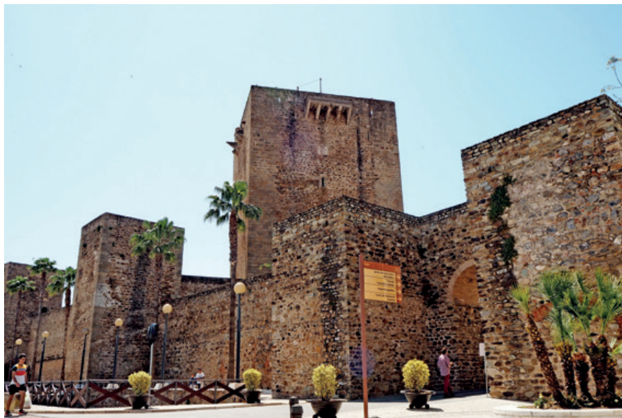
Las murallas y la torre del homenaje.

y la puerta de los Ángeles están enmarcadas por dos torreones circulares y presentan un vano de medio punto abovedado. Cierran la ciudadela medieval las puertas de la Gracia y la de San Sebastián, reconstruida en 2006.