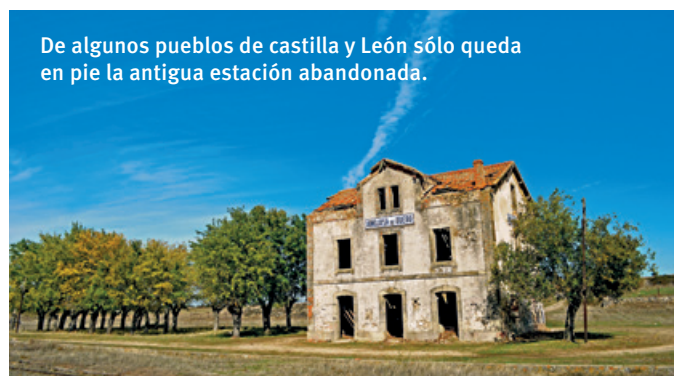
De algunos pueblos de Castilla y León sólo queda en pie la antigua estación abandonada.