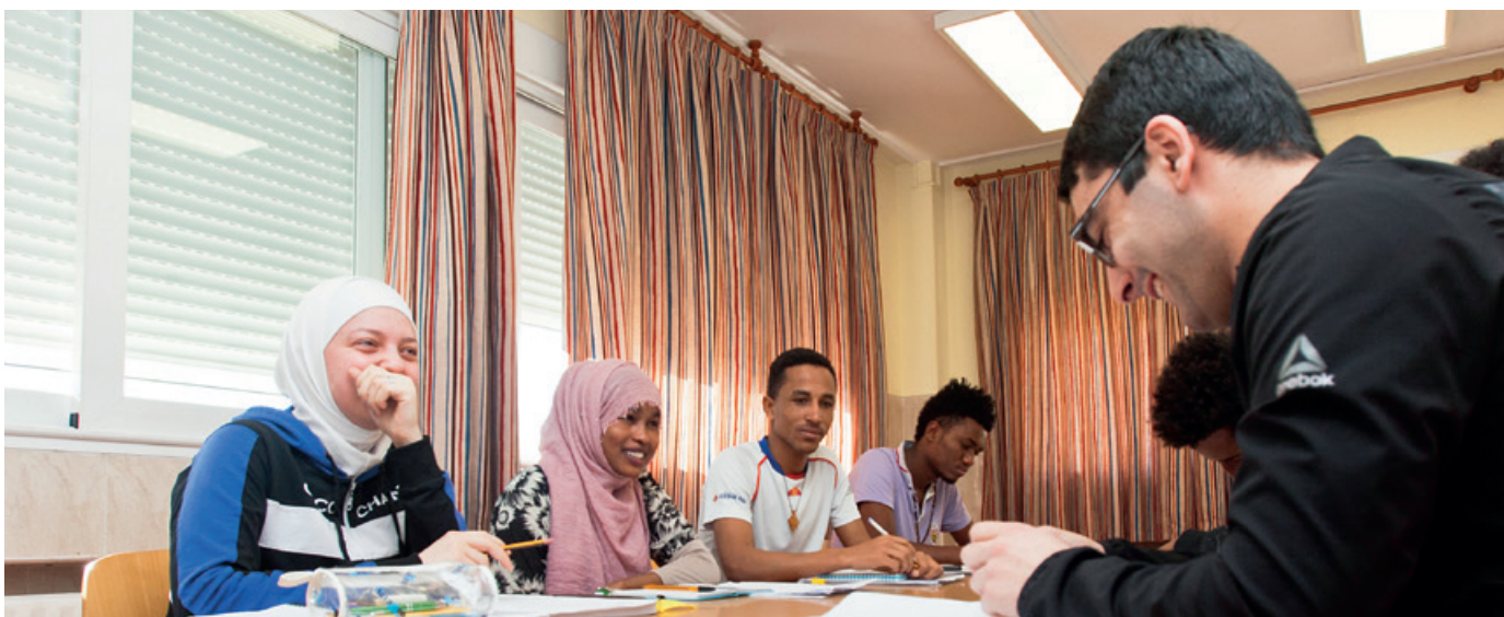
La población inmigrante se ha quintuplicado a lo largo del siglo XXI.

Todos los análisis coinciden en el diagnóstico y en la solución. La población española está envejeciendo y España necesita incrementar su inmigración para solucionar los problemas que eso conlleva