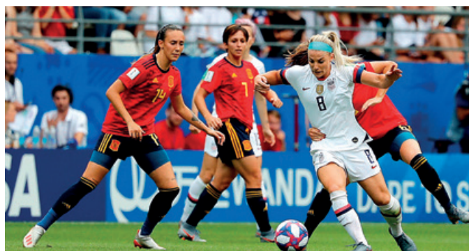
Las chicas de la absoluta cayeron con honores ante Estados Unidos, tras un buen campeonato.

Aparte del Campeonato, la selección sub-21 dejó varias buenas noticias. El descubrimiento para muchos de dos jugadores emigrados: Fabián Ruiz, sevillano que juega en el Nápoles, centrocampista de excelente técnica y disparo demoledor y Dani Olmo, natural de Tarrasa, centrocampista o extremo muy hábil e inteligente, al que parece que le queda poco en Dínamo de Zagreb croata. Otra sorpresa fue el centrocampista del Espanyol, Marc Roca, inmenso como medio centro.