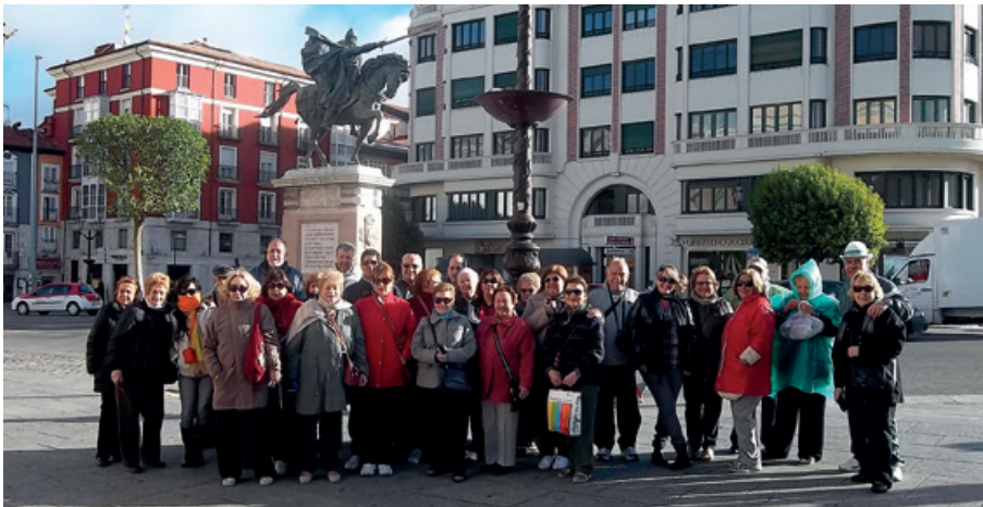
Un grupo de participantes en Burgos bajo la estatua ecuestre de El Cid.

El turismo de “raíces” es una tendencia y cobra relevancia en aquellos países en los que la oleada migratoria ha sido una constante