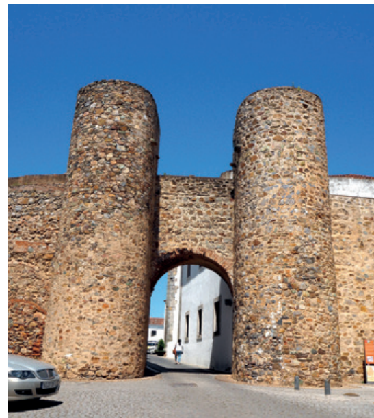
La Puerta de Alconchel con sus dos torres cilíndricas.