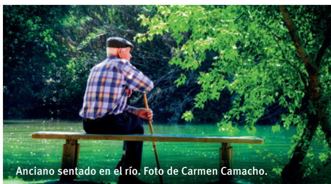
Anciano sentado en el río.

España comparte pues con otros países desarrollados el grave problema del desequilibrio de la pirámide poblacional (es decir, el envejecimiento), además de un acentuado desequilibrio demográfico territorial (dispersión y baja densidad por un lado y sobrepoblación estacional por otro). Desde hace décadas, la España interior se vacía en verano y los destinos de playa soportan un desmesurado aluvión estival; la Vía de la Plata se viene desangrando en las comarcas de ambos lados de la frontera a un ritmo sostenido; desde hace años, los portales de turismo digital ofrecen una ruta por los pueblos abandonados de Soria; los niños que proclamaban en 1.999 que “Teruel existe” hace tiempo que tuvieron que abandonar su tierra; cientos de pueblos de la Meseta y de Aragón, que nunca tuvieron industria de ningún tipo, carecen ahora de servicio médico, de escuela, de horno, de tienda y hasta de