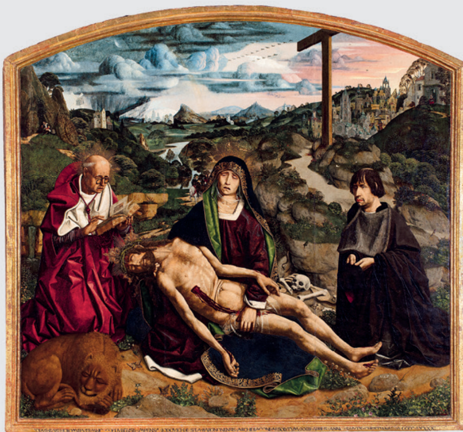
“Desplá Pietà” de Bartolomé Bermejo (1490). Museo Catedralicio de Barcelona.

La Galería Nacional Británica reivindica con una selecta antología a este genial artista cordobés, una de las figuras más atractivas de la Europa del Cuatrocientos