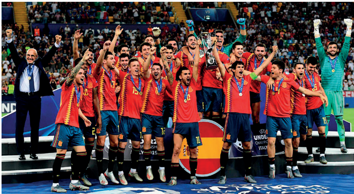
La “Rojita” levanta la copa tras derrotar a Alemania en la final.

La rojita venció a Alemania dos años después completando un espléndido campeonato que alumbra un equipo con mucho futuro