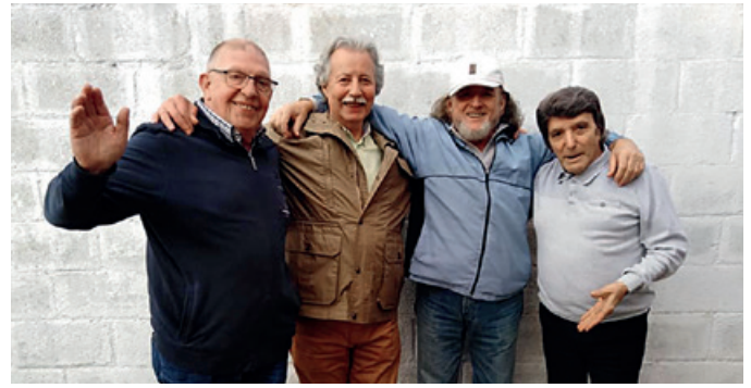
Reencuentro de Los Cuervos días antes del concierto.

El Festival Rumba Hispano Belga se articuló en torno a dos veladas, la primera dedicada al género del flamenco y la rumba, y la segunda protagonizada por los grupos, como el ya citado Los Cuervos, y las orquestas. Abrió el festival la actuación de El Niño de la Puebla, que fue el primer cantaor profesional flamenco en Bruselas y que a sus 84 años sigue viviendo en Anderlecht. Con él se abrió una primera parte del espectáculo dedicada a los pioneros del flamenco en Bélgica, a la que siguió un momento especialmente entrañable en que aquellos primeros maestros actuaron con sus hijos, también artistas profesionales en activo. Así la bailaora y maestra de bailaores Torre de Montijo actuó con su hija Sofía Yero, y el guitarrista Antonio Paz le tocó a su hijo, el cantaor y profesor de cante flamenco Antonio Paz Jr., quien a su vez presentó a su hija Malena Paz Cabrera, en el que fue el debut de la pequeña de la saga sobre un escenario.