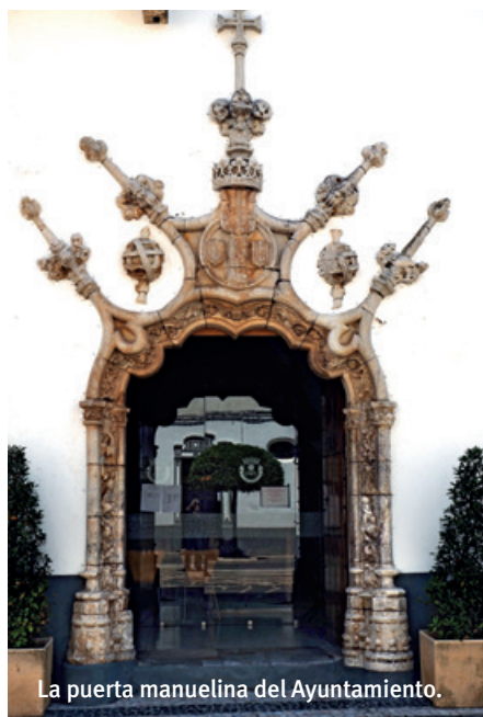
La puerta manuelina del Ayuntamiento.