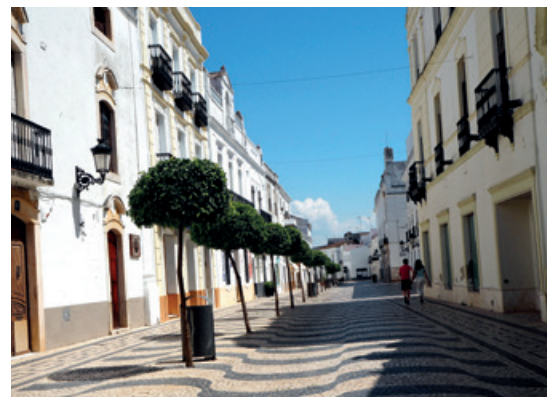
Algunas calles muestran el empedrado portugués.