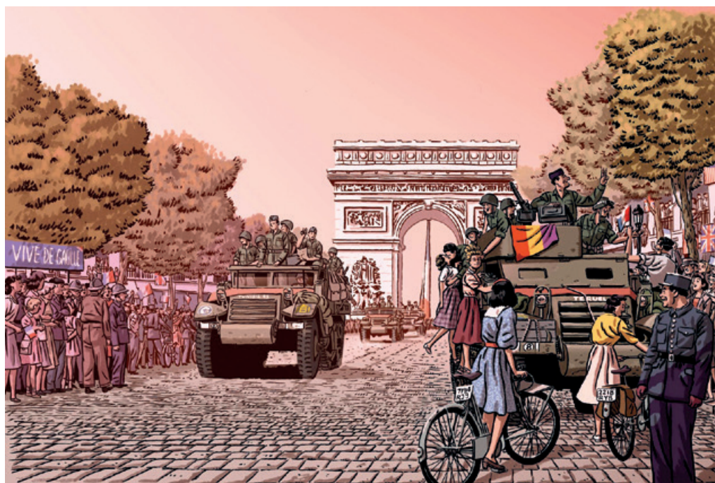
Dibujo de portada de “Los surcos del azar” edición especial.