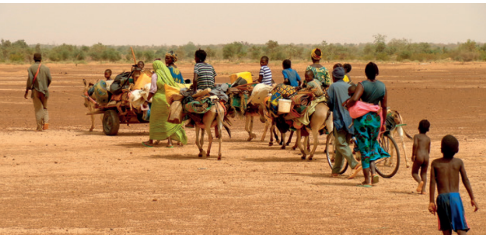
Un grupo de familias huye de la guerra en Burkina Faso.

sociales y ambientales entre las zonas urbanas y rurales. La OCDE alerta a los países miembros sobre los problemas derivados de la creciente longevidad de sus habitantes: aumento de las discapacidades por el envejecimiento, mayor demanda de atención geriátrica, imposibilidad de las familias de atender a sus mayores. El Fondo Monetario Internacional, como es lógico, ha puesto el foco en los efectos de la transición demográfica actual sobre el ahorro, las inversiones y flujos de capital, así como en los niveles de riesgo asociados a cada país y al crecimiento de la productividad en los países en desarrollo. La OIT en cambio se centra en sus informes en la organización de los trabajos de cuidado de mayores y en las acciones que contribuyen a la creación de empleo digno en este ámbito. La Unión Europea, en fin, en el Pilar Europeo de Derechos Sociales, afirma el derecho