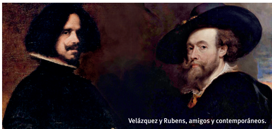
Velázquez y Rubens, amigos y contemporáneos.

El rey encargó a su protegido Velázquez (1599–1660), que se pusiera a disposición del artista flamenco para servirlo en todo cuanto necesitara. Velázquez, entonces un joven que aún no había desarrollado del todo su talento, le proporcionó un taller para que trabajara y le mostró las colecciones tanto de Madrid como de los Sitios Reales.