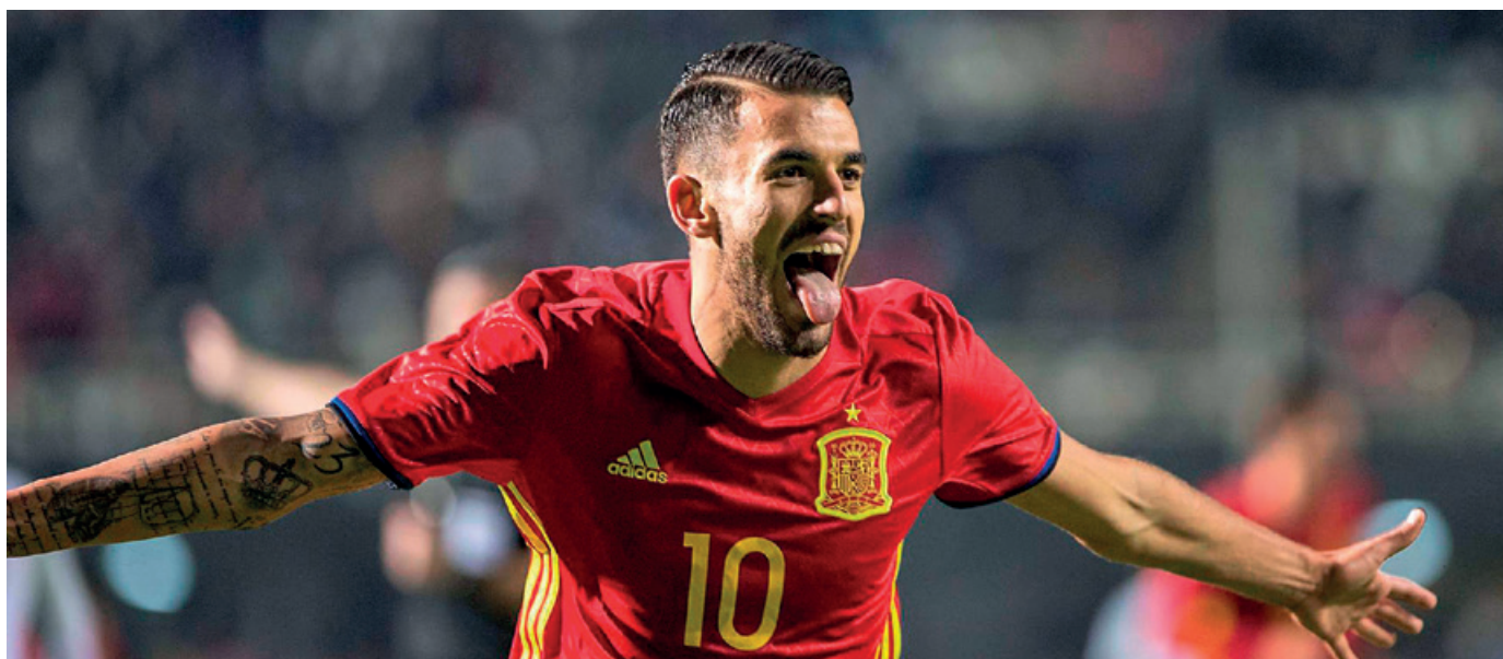
Dani Ceballos, el cerebro de la selección sub-21.