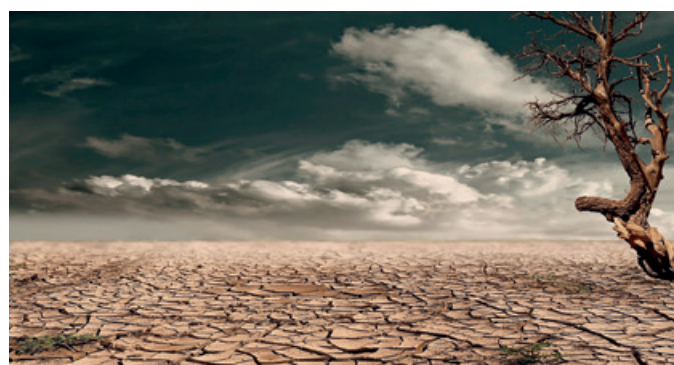
La sequía y la desertización son una causa fundamental de las migraciones.

bar. Hay pueblos de los que sólo quedan ruinas y las tumbas del cementerio.