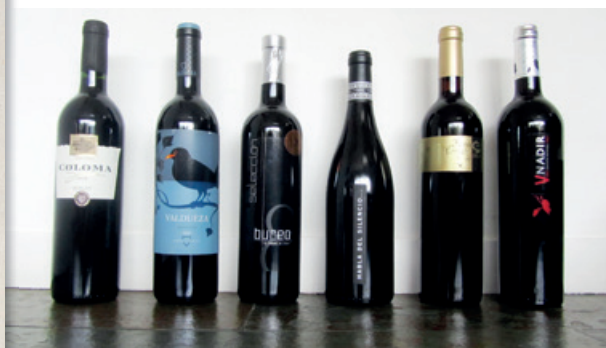
Una selección de tintos extremeños.

na. Se hace también cava con uva Chardonnay y mezclada con macabeo.