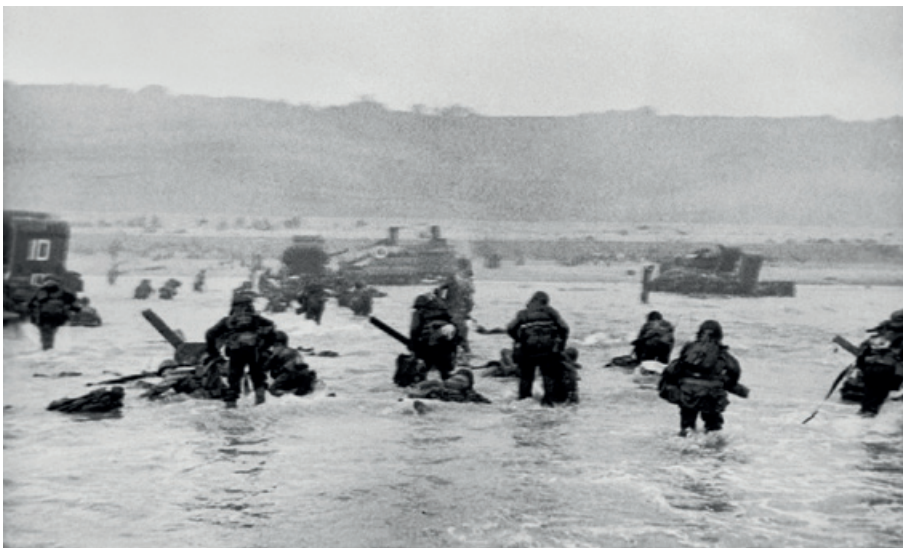
Una de las imágenes del desembarco de Normandía tomadas por Robert Capa.