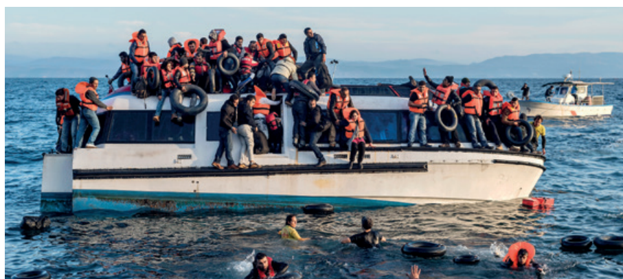
Un barco con refugiados iraquíes y sirios llega a Skala Sykamias, Lesbos.