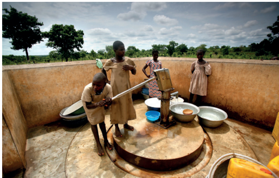
Mujeres jóvenes extrayendo agua de un depósito en Togo.

Para implementar los 17 Objetivos de Desarrollo Sostenible de la Agenda 2030, la ONU recomienda aumentar las inversiones en infraestructura rural y reforzar los vínculos económicos,