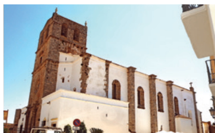
La iglesia de Santa María Magdalena.